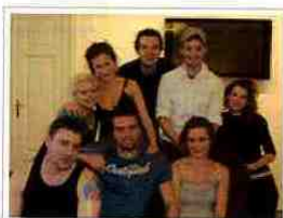
Das gesamte Team auf und hinter der Bühne - von Bucharest Calling